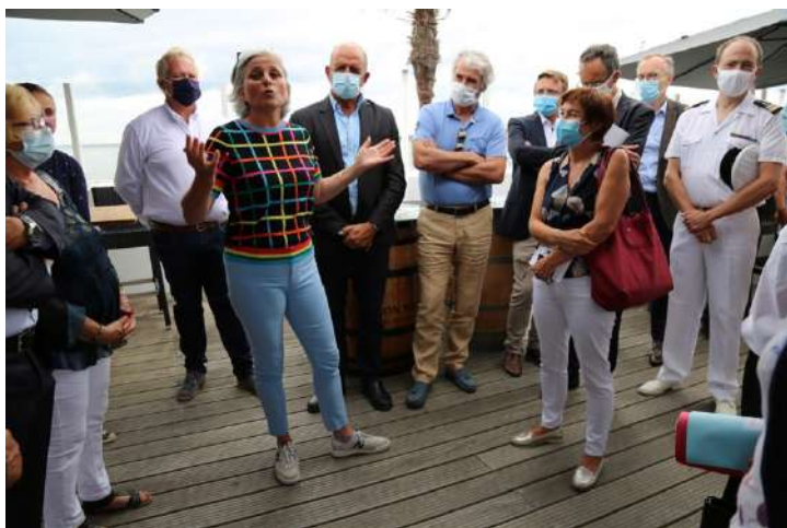
Vendredi 13h : Accueil républicain de la ministre aux Terrasses du Port, restaurant qui domine le port d’Arcachon

Cette visite a été marquée par de multiples rencontres avec les acteurs locaux du maritime : de la découverte de chantiers navals traditionnels, aux échanges avec les acteurs associatifs du surf, de la plongée mais également de la SNSM ; sans oublier la découverte des pinasses électriques et hybrides pour faire rimer transition énergétique et protection du milieu marin.