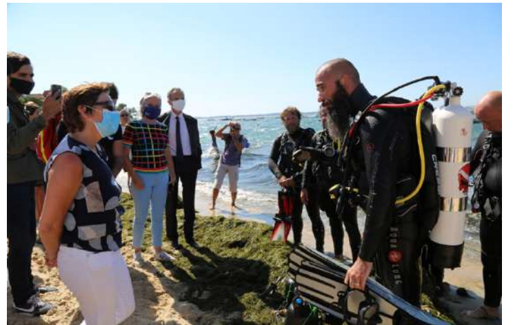
Vendredi 17h : Rencontre avec les Nettoyeurs Sous-marins Arcachonnais, qui remontaient d'une plongée consacrée au ramassage des déchets