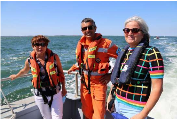
Vendredi 16h30 : Navigation sur le canot de la SNSM et dialogue avec les bénévoles des trois stations du Bassin