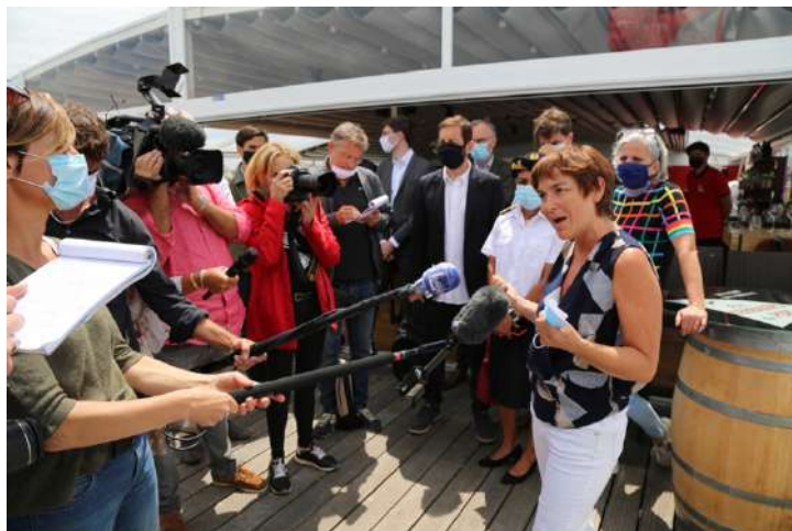
Vendredi 14h : Point presse avec les médias locaux, régionaux et nationaux