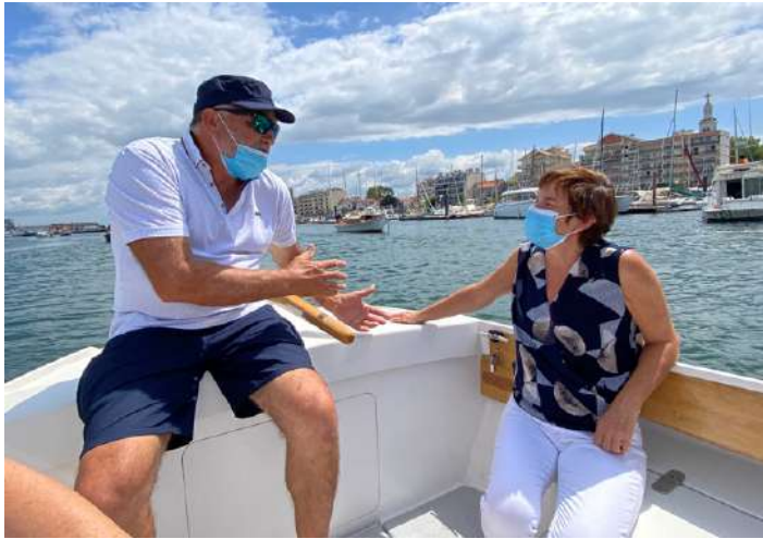
Vendredi 15 h : Embarquement à bord d'une pinasse électrique conçue par E-Marine