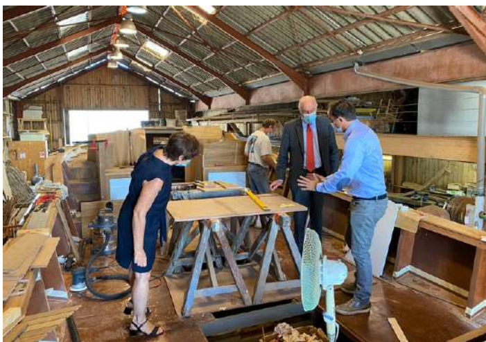
Samedi 10h : Visite des chantiers navals traditionnels Bonnin & Bossuet à Arcachon et à La Teste-de-Buch