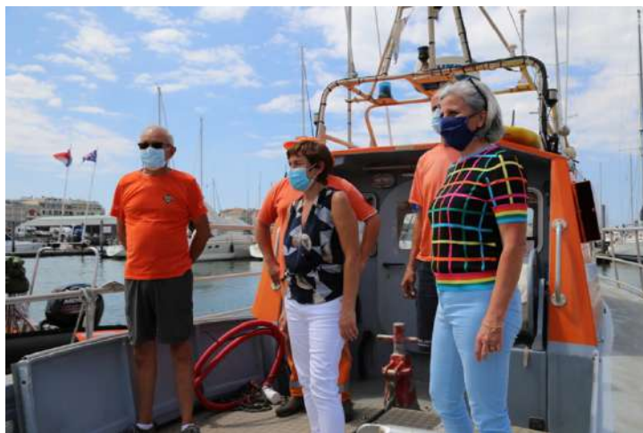
Vendredi 14h45 : Rencontre avec les bénévoles de la SNSM d’Arcachon