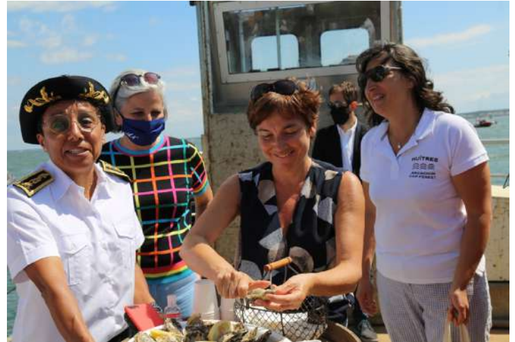
Vendredi 15h30 : Dégustation d'huitres sur une plate ostréicole, à quelques encablures des cabanes tchanquées, en présence des représentants de la conchyliculture du Bassin