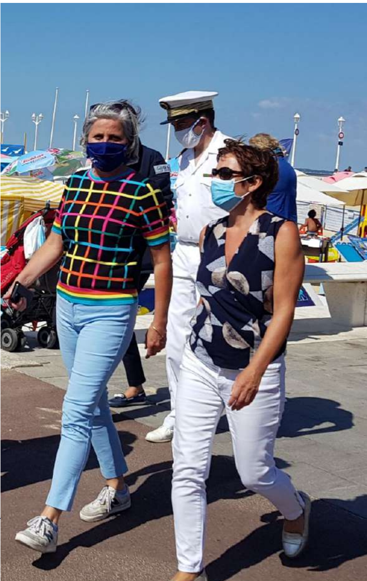
Sophie PANONACLE Députée de la Gironde

Je vous donne rendez-vous à la rentrée pour lancer, ensemble, la préparation de l'édition 2021.