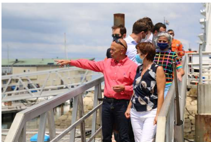
Vendredi 14h30 : Découverte du port d’Arcachon avec le directeur du port de plaisance